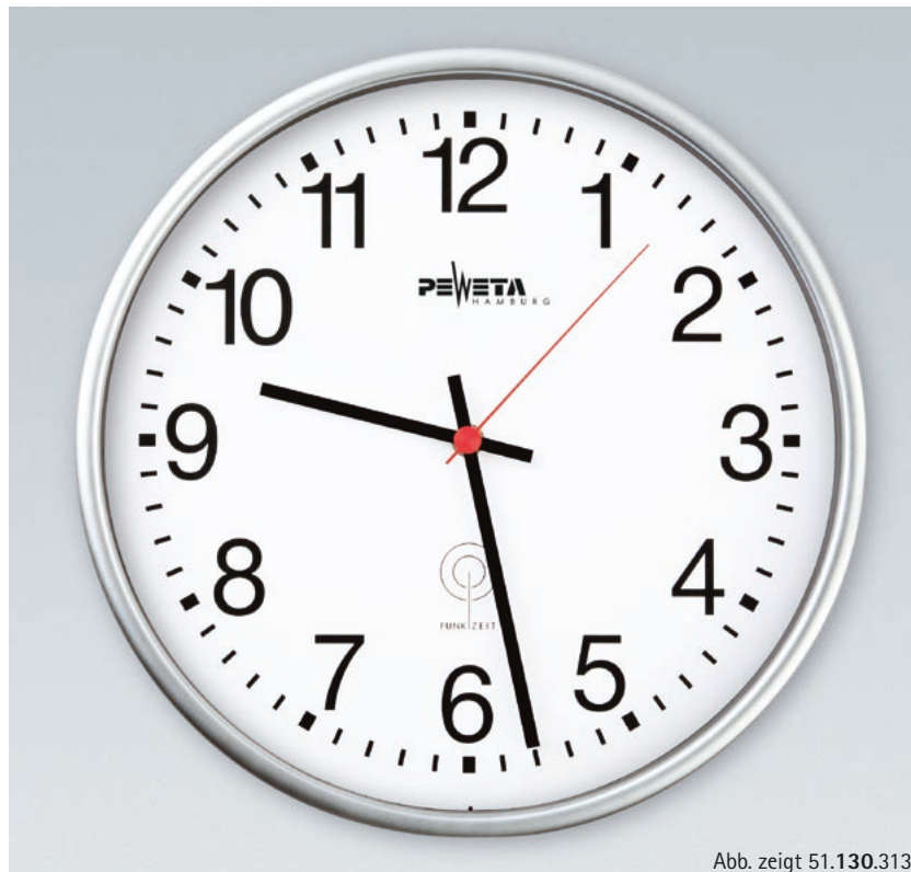
Abb. zeigt 51.130.313

Funkuhren DCF77: Bei Funkuhren kann in Einzel- fällen durch ortsbedingte Gegebenheiten die Funk- empfangsqualität beeinträch- tigt werden.