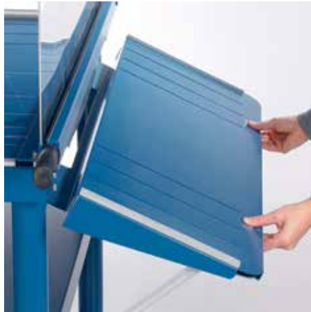
Klappbarer Vordertisch für Schneidearbeiten im Großformat