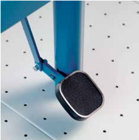
Komfortable Fußpressung für ein sicheres Anpressen von großformatigem Schnittgut