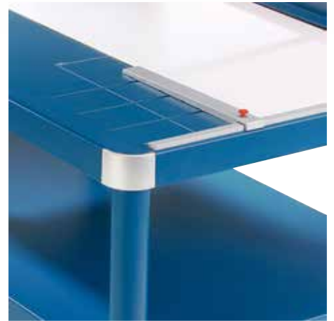
Verstellbarer Metall-Rückanschlag zur schnellen Formatfindung - auf beiden Winkelanlagen und dem Vordertisch einsetzbar