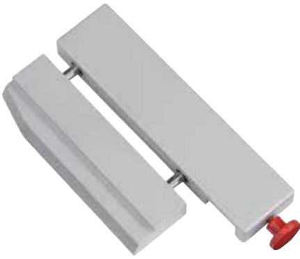
Schmalstreifen-Schneidevorrichtung zum Schneiden extrem feiner Streifen - optional