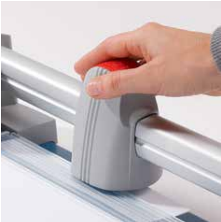
Ergonomischer Schneidekopf für eine komfortable Bedienung der Schneidemaschine