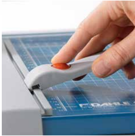
Verstellbarer Rückanschlag zur schnellen Formatfindung - auf beiden Winkelanlagen einsetzbar