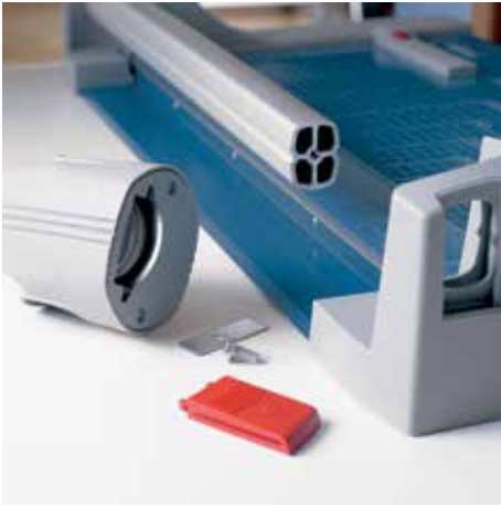
Einfacher Messerkopfwechsel sorgt für reibungslose Arbeitsabläufe