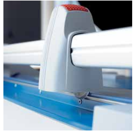
Rundmesser im geschlossenen Kunststoffkopf gewährleistet ein Höchstmaß an Sicherheit