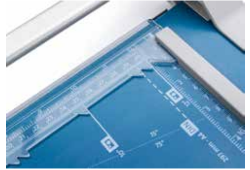
Dahle Schneidemaschinen 507 (Generation 3)