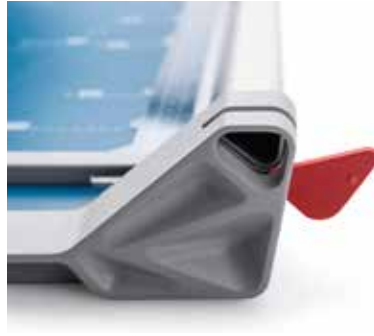
Dahle Schneidemaschinen 507 (Generation 3)