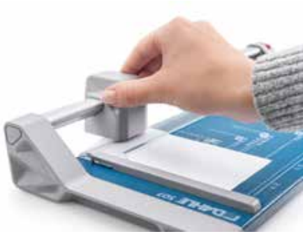
Dahle Schneidemaschinen 507 (Generation 3)