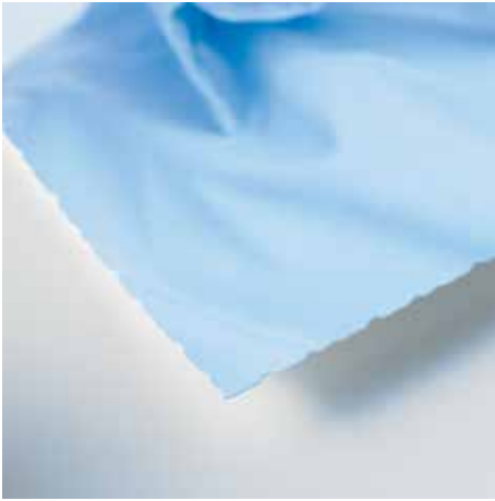
Büthen-Schnittkante zur Papierveredelung