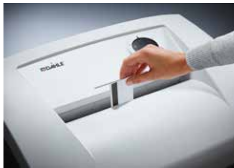
Dahle Aktenvernichter Office 410