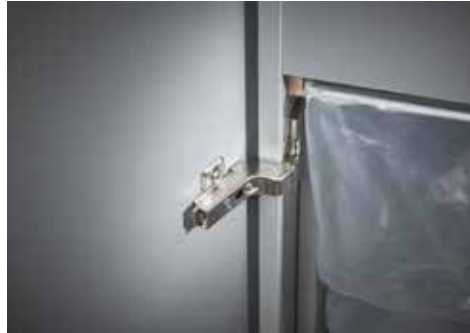
Dahle Aktenvernichter Office 410