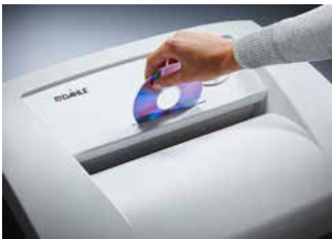
Dahle Aktenvernichter Office 410