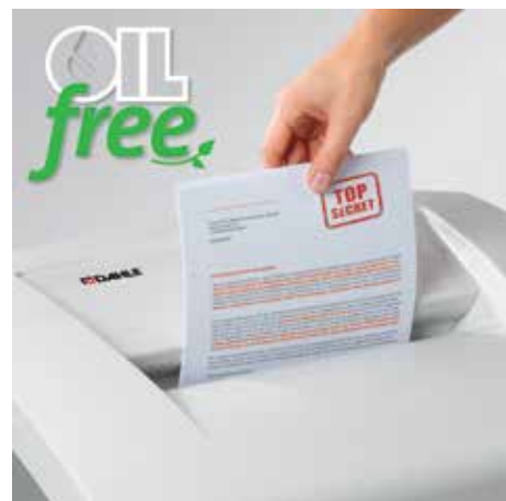
Komfortabel vernichten, völlig ohne zeitraubendes Ölen der Schneidwalzen