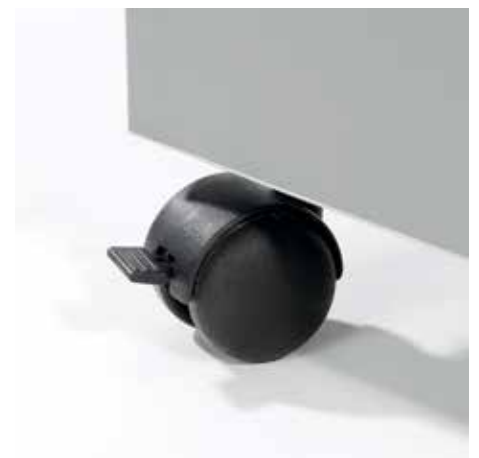
Praktische Lenkrollen für den flexiblen Einsatz