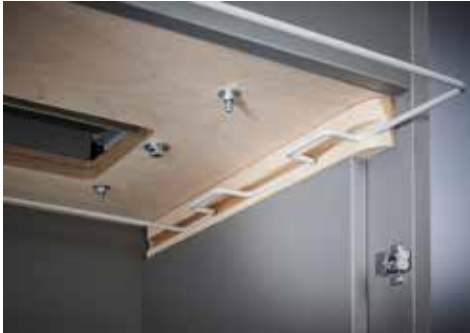
Dahle Aktenvernichter Office 410