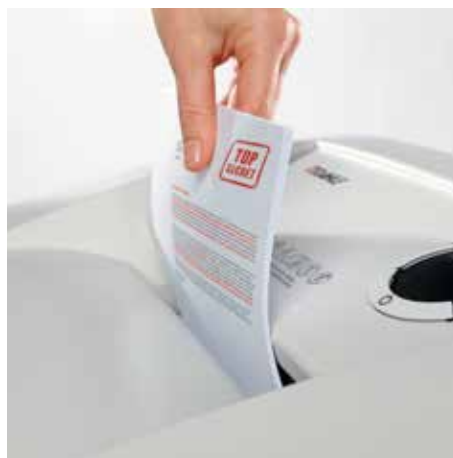
Bis zu 30 % höhere Blattleistung durch die innovative MHP Technology®