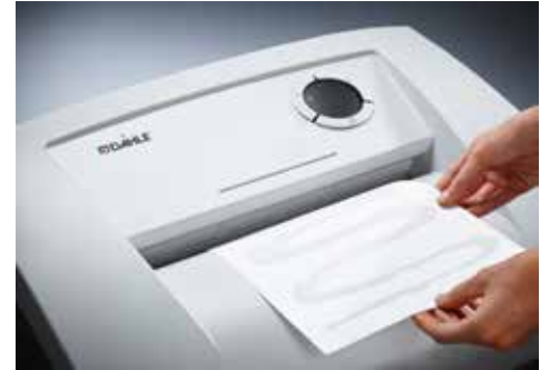
Dahle Aktenvernichter Office 410