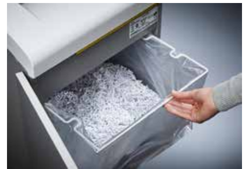
Dahle Aktenvernichter Office 410