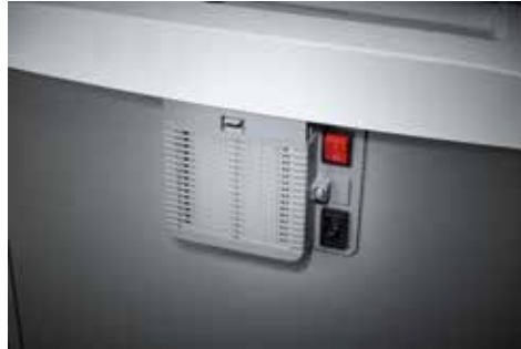
Dahle Aktenvernichter Waste 110air