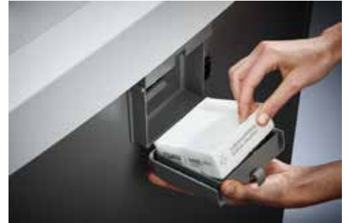
Dahle Aktenvernichter Waste 110air