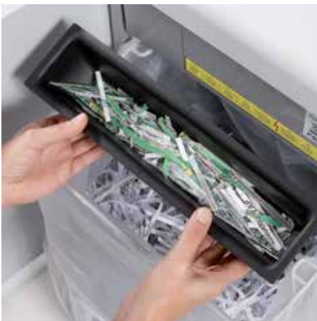
Separate, integrierte Auffangbehälter unterstützen bei der umweltfreundlichen Abfalltrennung von Papier und CDs, DVDs, Scheck- und Kreditkarten