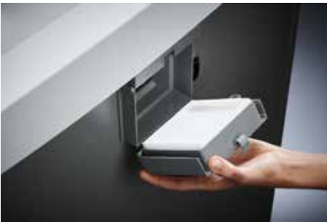
Dahle Aktenvernichter Waste 110air