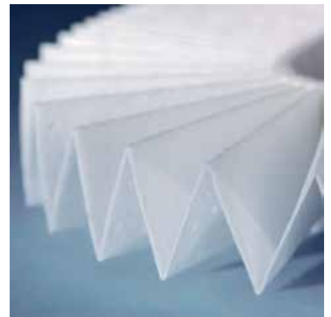
Umweltfreundlicher Filter aus 3-lagigem, vollständig recyclebarem Spezialvlies