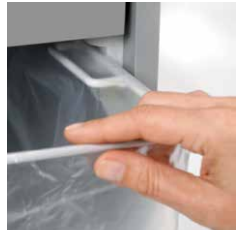
Ausziehbare, abgerundete Schiene ermöglicht das komfortable Wechseln des Auffangbeutels