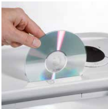
Separater Eingabeschlitz für CDs, DVDs, Scheck- und Kreditkarten garantiert eine sichere Vernichtung von optischen, magnetischen und/oder elektronischen Datenträgern