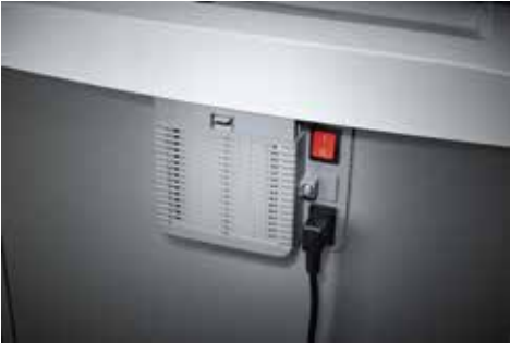
Dahle Aktenvernichter Waste 110air