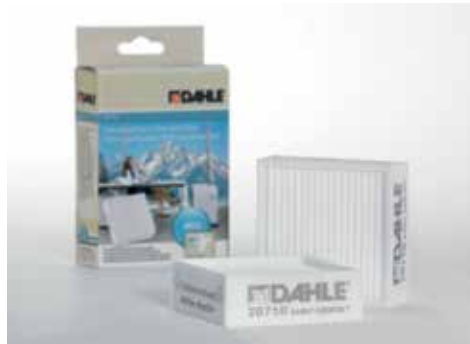
Feinstaubfilter Dahle 20710