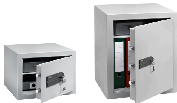
C 1 S