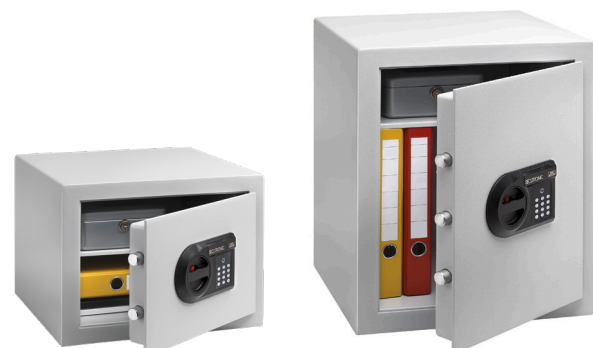
C 1 E