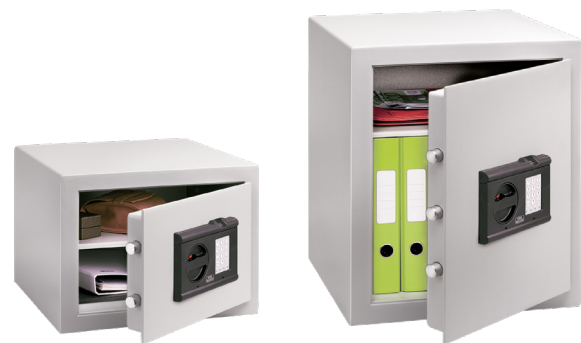
C 1 E FS