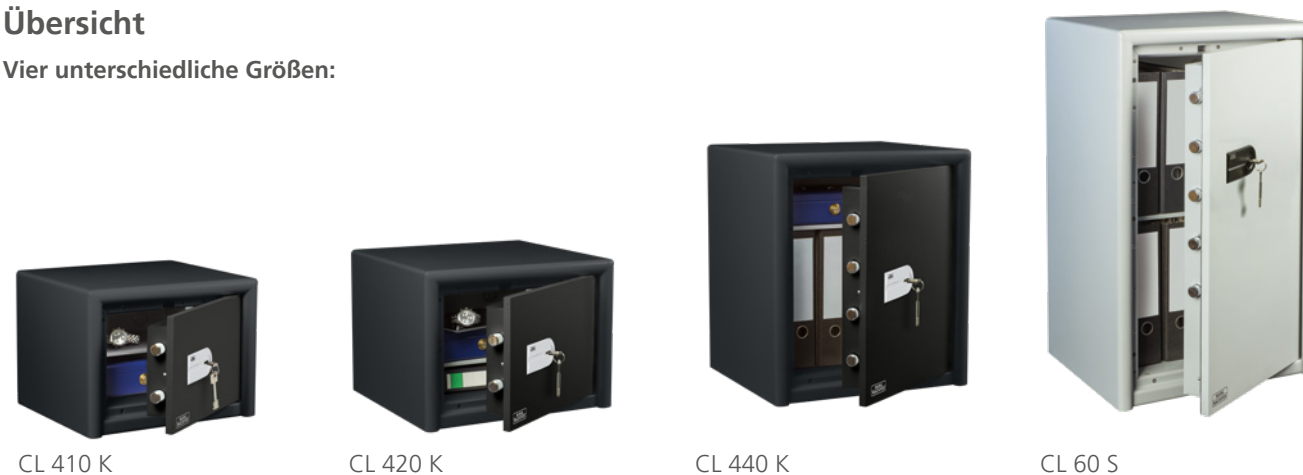
CL 410 K