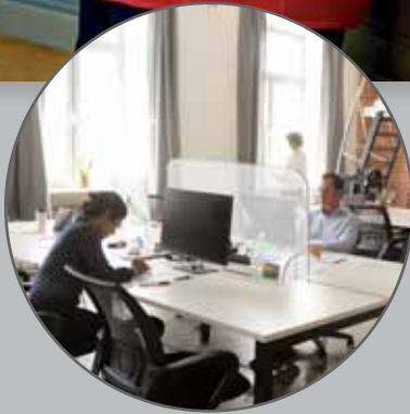
Auch als Arbeitsplatz-Trennung geeignet

Diese Schutzscheibe eignet sich für Kassen- und Thekenbereiche mit direktem Personenkontakt. Sie trennt die Personen physisch voneinander und ermöglicht gleichzeitig das Übergeben von Waren und Gegenständen. So kann die Hygiene und Sicherheit für Kunden und Mitarbeiter erhöht werden.