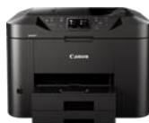
MAXIFY MB2750 Modelle